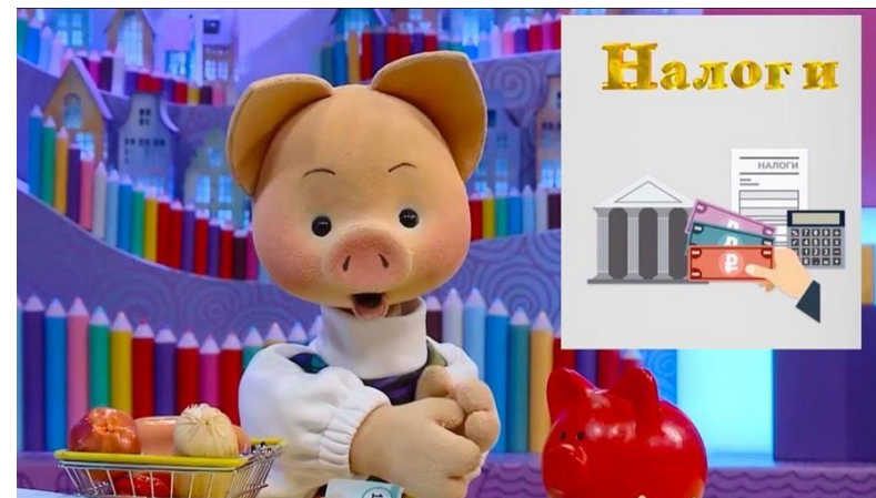
Спокойной ночи, малыши (по ФГ)