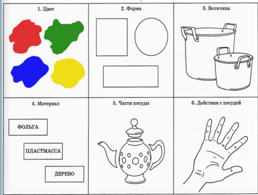
№ 2. Схема описания и сравнения посуды

Пересказ рассказа, составленного по демонстрируемому действию.