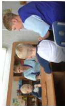
Памятка для родителей