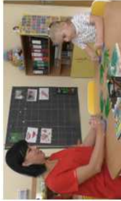
Буклет для родителей